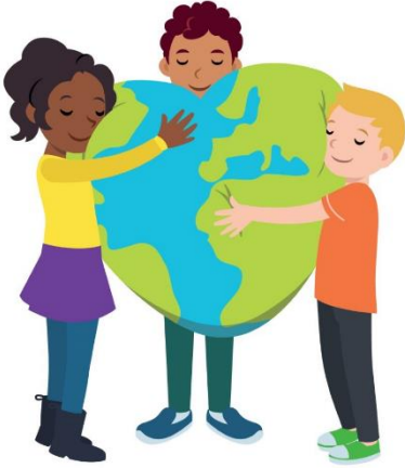
We hebben hart voor elkaar

We zijn gestart met blok 4: 'We hebben hart voor elkaar', in dit blok hebben we het over onze emoties. Om kunnen gaan met gevoelens is van groot belang voor een positief klimaat in de klas en in de school. De Vreedzame School streeft naar een klimaat waarin iedereen zich prettig voelt en waarin kinderen 'hart voor elkaar' hebben, d.w.z. dat ze met respect omgaan met elkaar. Dat gaat makkelijker als kinderen in staat zijn hun gevoelens te benoemen en zich in de gevoelens van anderen kunnen verplaatsen. Kinderen zijn dan beter in staat om conflicten positief op te lossen. Om met elkaar over gevoelens te praten, is het van belang dat de kinderen zich veilig voelen in de groep; tegelijkertijd bevorderen deze gesprekken de veiligheid in de groep. Er ontstaat een vertrouwde sfeer. Bij het praten over gevoelens leren we de kinderen ook dat ze mogen "passen". Passen houdt in dat je jouw beurt afslaat, als je even niet wilt praten. We willen kinderen namelijk de ruimte geven om zelf te kiezen wat ze over hun gevoelens kwijt willen.